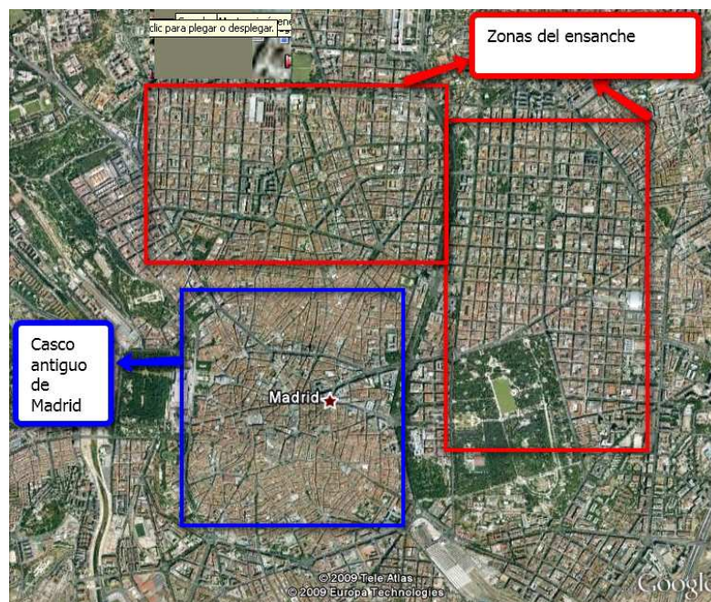
Imagen de Agrega , Junta de Andalucía (dominio público)